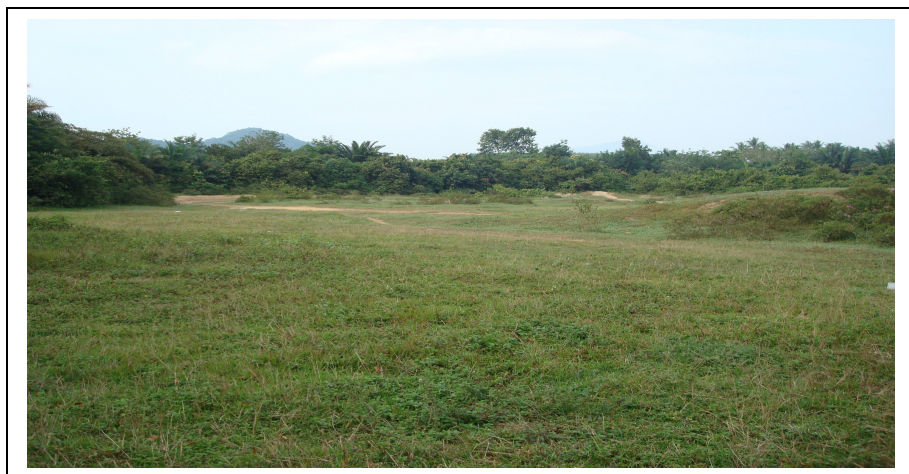
LOKASI TAPAK PROJEK

Kawasan ini dikategorikan sebagai zon kawasan pertanian. Sifat-sifat utama tanah di kawasan ini ialah berwarna kuning coklat, mempunyai lempung berpasir kasar, berstruktur blok subsegi, bersaiz halus, peroi, sederhana salir ke salir dan ketepuan bes rendah.